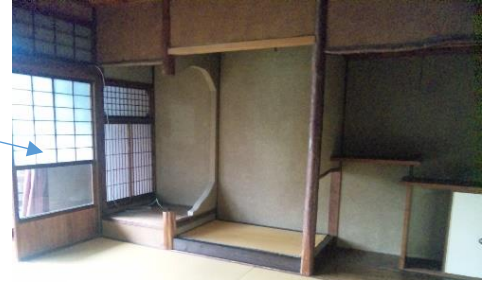
2階 床の間付8畳和室